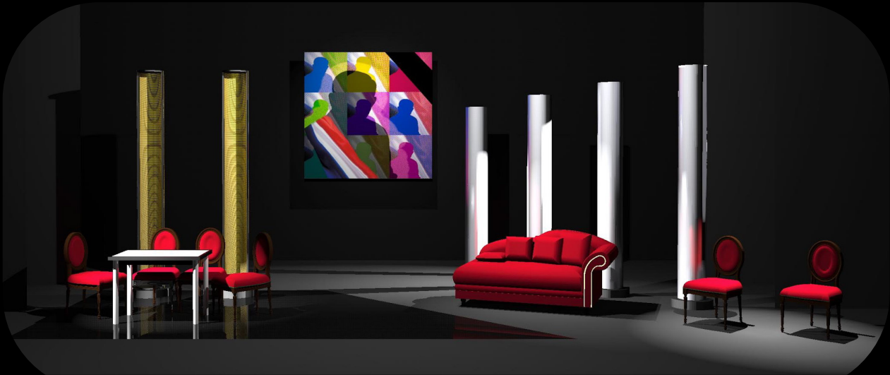
Esquisse du décor

Dans cette vision moderne du Misanthrope, les vers de Molière seront respectés jusqu'au dernier.